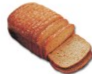
Et brød Chleb