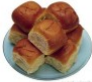
Et rundstykke Bulka