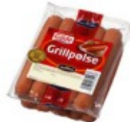
En pølse Parówka