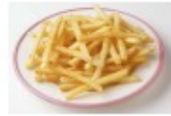
Pommes frites Frytki