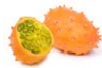
En granateple Granat