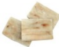
En torsk Dorsz