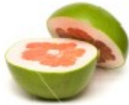
En grapefrukt Grejpfrut