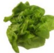
En salat Salata