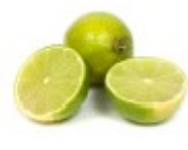
En sitron Cytryna