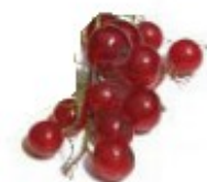
En rips Porzeczka