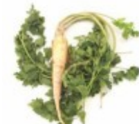
Ei/en persille Pietruszka