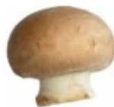
En champinjong Pieczarka