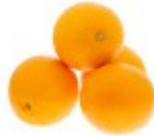
En appelsin Pomarańcza