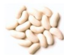
Ei/en bønne Fasola