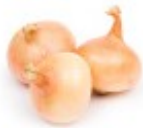
En løk Cebula