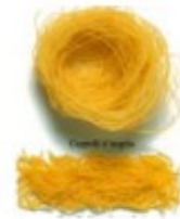
En makaroni\ pasta Makaron