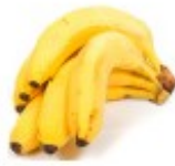
En banan Banan