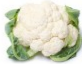
En blomkål Kalafior