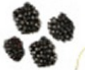
En bjørnebær Jeżyna