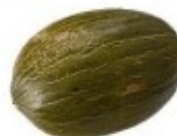
En melon Melon