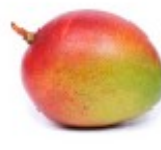
En mango Mango