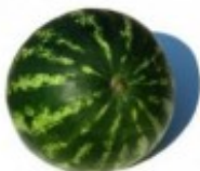
En vannmelon Arbuz