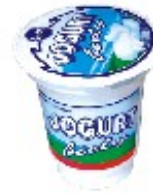
En yoghurt Jogurt