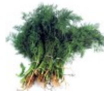
En dill Koper