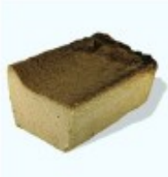
Kyllingpostei Pasztet drobiowy