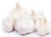
En hvitløk Czosnek