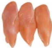
En killing file Pierś z kurczaka