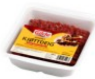
Et kjøtt Mięso mielone