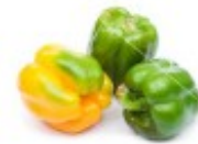
En grønn paprika Zielona papryka