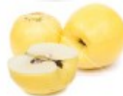
En eple Jabłko