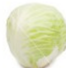
En kål Kapusta