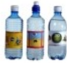
Mineralvann Woda mineralna