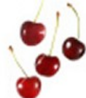
En morell Czereśnia