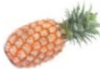
En ananas Ananas