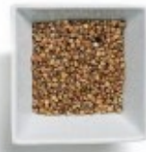
En grøt Kasza