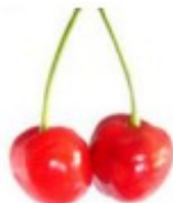
Et kirsebær Wiśnia