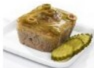
Leverpostei Pasztet drugi