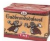
Brun ost Ser brązowy